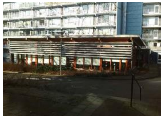
Figuur 4: Wijksteunpunt Noord

In 2016 hebben we voor onze inloopavonden weer kosteloos gebruik mogen maken van Wijksteunpunt Noord van het Centrum voor Maatschappelijk Werk en Welzijnswerk (CMWW) in Brunssum. Het CMWW levert op onze avonden ook een vrijwilliger die zorgt voor koffie, thee en fris. We hebben in 2016 ook toestemming gekregen van Cicero Zorggroep om hun naastgelegen ruimte te gebruiken. Vergaderingen houden wij bij vrijwilligers thuis.