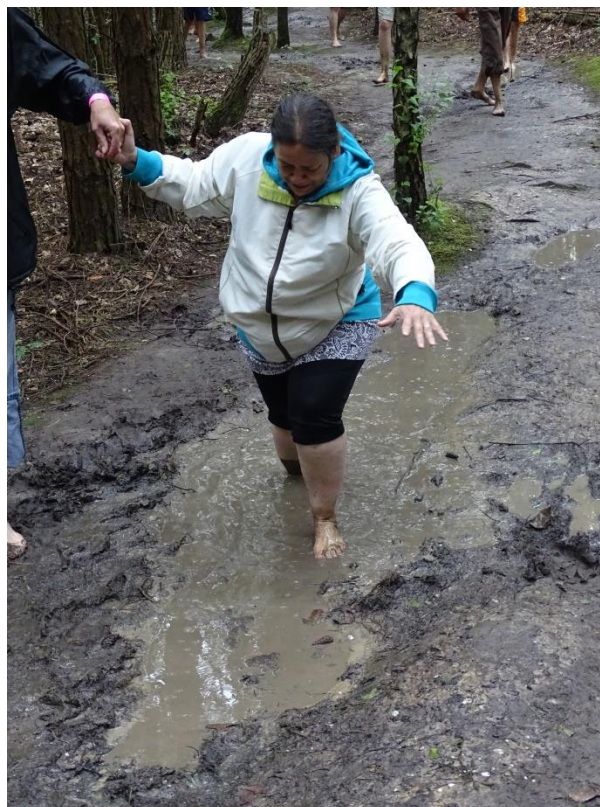
Figuur 3: Blotevoetenpad Brunssum

Een overzicht van de geplande activiteiten in 2017 vindt u in bijlage 4 op pagina 14.