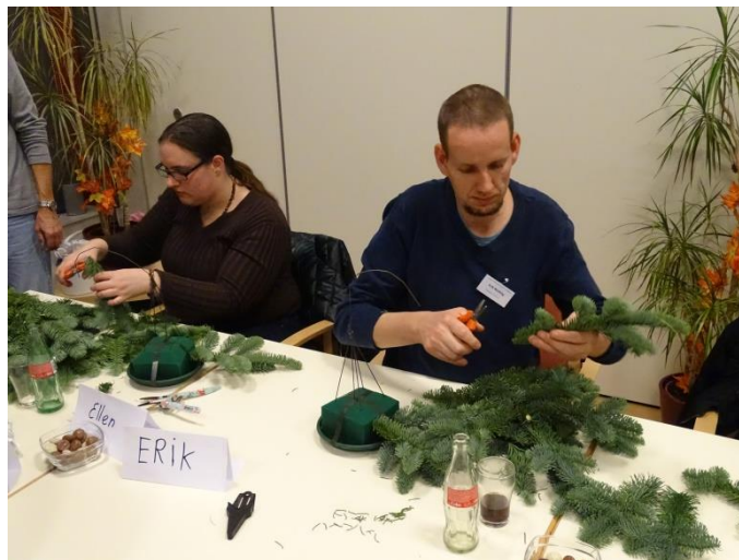
Figuur 2: Kerststukje maken

Een overzicht van alle inloopavonden in 2016 met het aantal deelnemers vindt u in bijlage 1 op pagina 11.